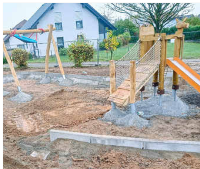
Hier entsteht der Spielbereich für Kleinkinder.