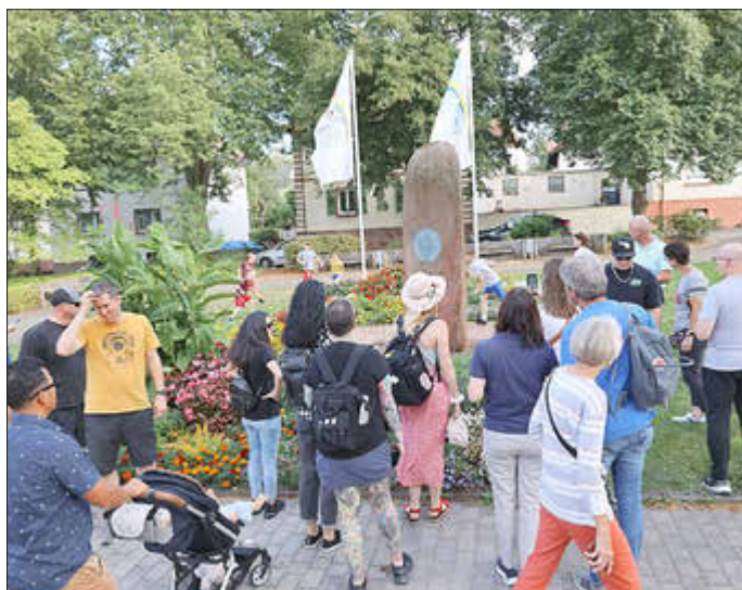
Die Gruppe begutachtet den Gedenkstein am John-F. Kennedy-Platz