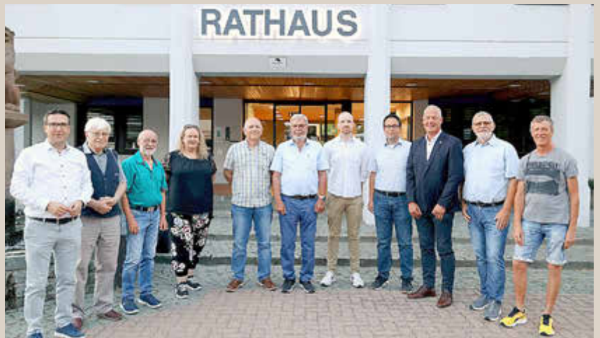
Die geehrten ausgeschiedenen Ratsmitglieder.