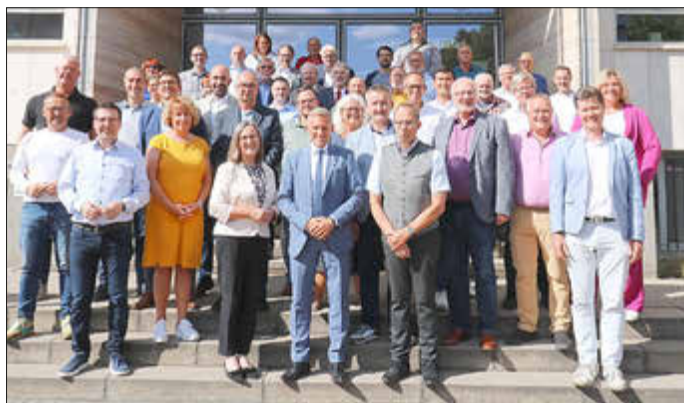
Gruppenbild neuer Kreistag.