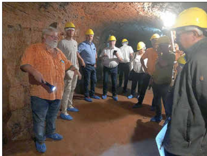
Besichtigung des historischen Bierkellers in Schönenberg-Kübelberg