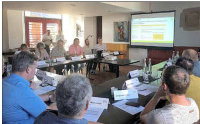
Vorstandssitzung der LAG Westrich-Glantal in der Tenne des Kulturhauses in Schönenberg-Kübelberg