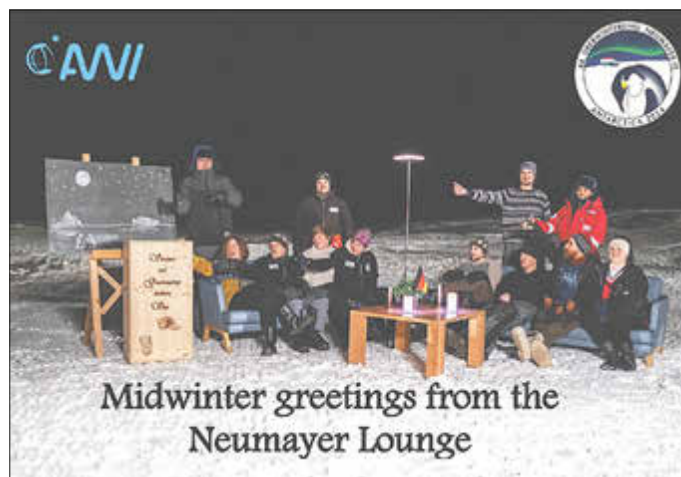
Mittwinterfest bei minus 30 Grad auf der Neumayer-Station in der Antarktis mit der Weinkiste aus der Pfalz.