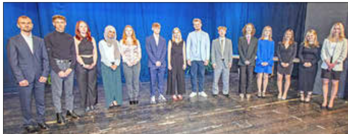
Gruppenbild mit allen geehrten Schülerinnen und Schülern.