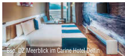
Bsp. DZ Meerblick im Carine Hotel Delfin