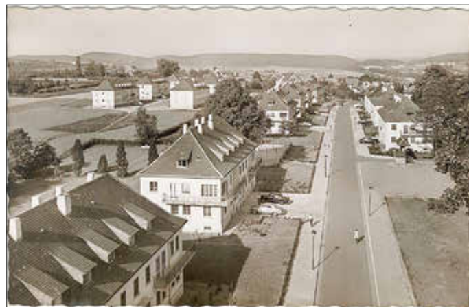
Blick auf die Fliegerstraße.