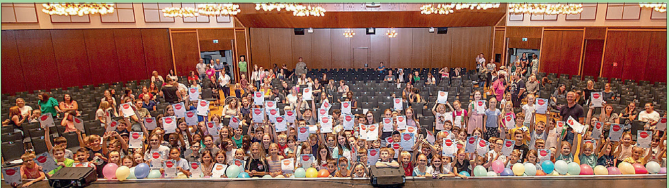
Großes Gruppenbild mit allen anwesenden Jungs und Mädchen.