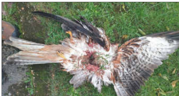
Der komplett von einem Projektil durchschlagene Rotmilan.

Naturschutzbehörde und Ortsgemeinde bitten Anwohner, vor allem im Bereich zwischen Landstuhler Straße und Weidenstraße, sich bei Polizei oder Ortsbürgermeister zu melden, falls sie etwas gesehen oder gehört haben könnten.