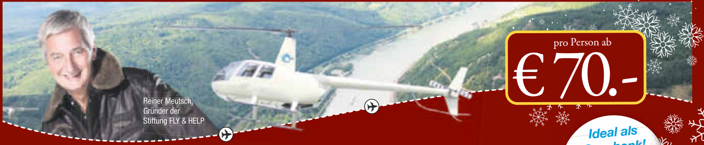
Reiner Meutsch, Gründer der Stiftung FLY & HELP