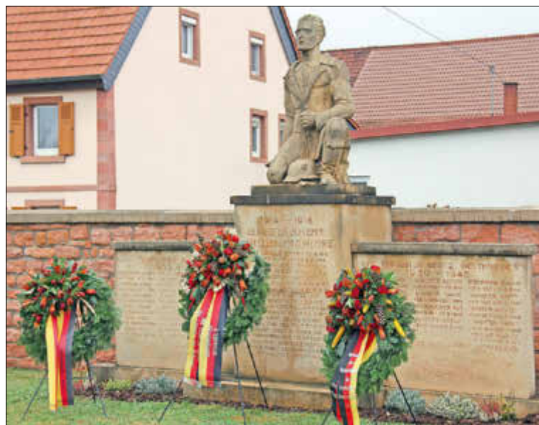
Eine der Gedenkstätten für die Opfer der beiden Weltkriege in der Verbandsgemeinde: das Ehrenmal in Katzenbach.

11.00 Uhr Gedenkfeier in der protestantischen Kirche Steinwenden, anschließend Kranzniederlegungen in Steinwenden, Weltersbach und Obermohr