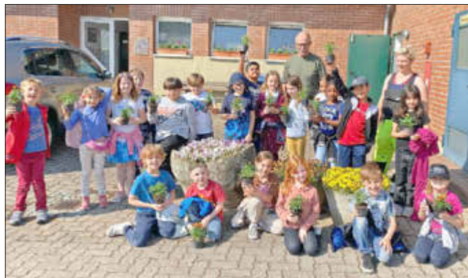
Die Eulenklasse der Wendelinusschule mit ihren selbst eingepflanzten Studentenblumen.