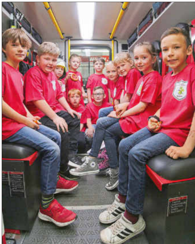
Bereit zum Einsatz: die Jungs und Mädchen der Babinifuerwehr.

Passend am Florianstag, dem Namenstag des Schutzpatrons der Feuerwehr, wurde die Vorbereitungsgruppe für die Jugendfeuerwehr - oder, kurz, die Babinifuerwehr, gegründet.