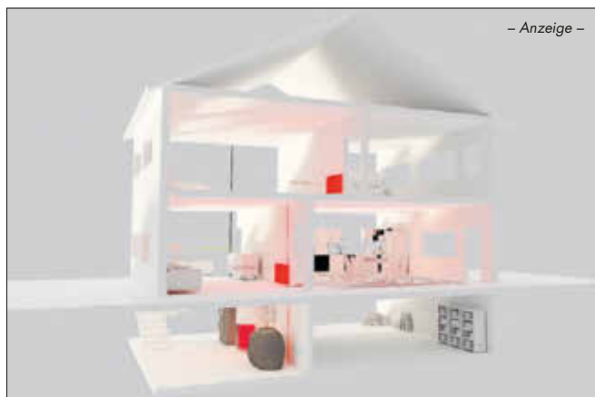
– Anzeige –