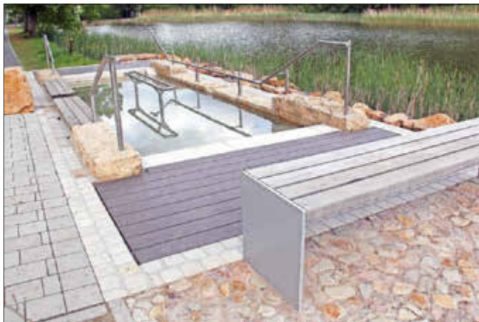
Das Kneippbecken am Seewoog ist wieder gereinigt und gefüllt.

Im Naherholungsgebiet am Seewoog in Miesenbach kann ab sofort wieder „gekneippt“ werden. Das neue Kneippbecken auf der Südseite des Sees wurde vom Bauhof der Verbandsgemeinde gereinigt und gefüllt und steht den Besuchern des Naherholungsgebietes wieder zur Verfügung.