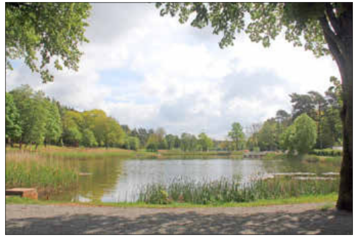
Für die Nordseite des Seewoogs (links) sollen neue Sitzmöbel angeschafft werden.

Auf der jüngsten Sitzung des Stadtrates vom 20. Mai wurde für die Nordseite des Seewooges eine Neumöblierung beschlossen. Wie der Vorsitzende, Stadtbeigeordneter Ludwig Linsmayer, erläuterte, sei die noch vorhandene Möblierung in diesem Bereich stark verwittert und größtenteils nur noch schlecht nutzbar. Die alten Bänke und Tische sollen nun durch neue ersetzt werden. Vom Stil her sollen sie zur neuen Ausstattung im Kioskbereich passen, um ein harmonisches Gesamtbild der ganzen Anlage entstehen zu lassen. Des Weiteren sollen die Fahrrad-Anlehnbügel im Bereich des Spielplatzes ergänzt werden. In der bisherigen Nutzung hat sich gezeigt, dass die momentane Anzahl nicht ausreichend ist.