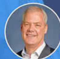
Ralf Hechler Bürgermeister der Verbandsgemeinde