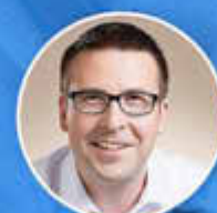
Marcus Klein 1. Bürgermeister der Verbandsgemeinde