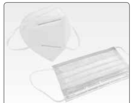
FFP1 / FFP2