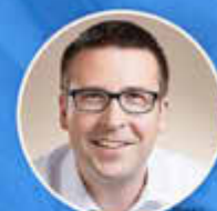
Marcus Klein 1. Bürgermeister der Verbandsgemeinde