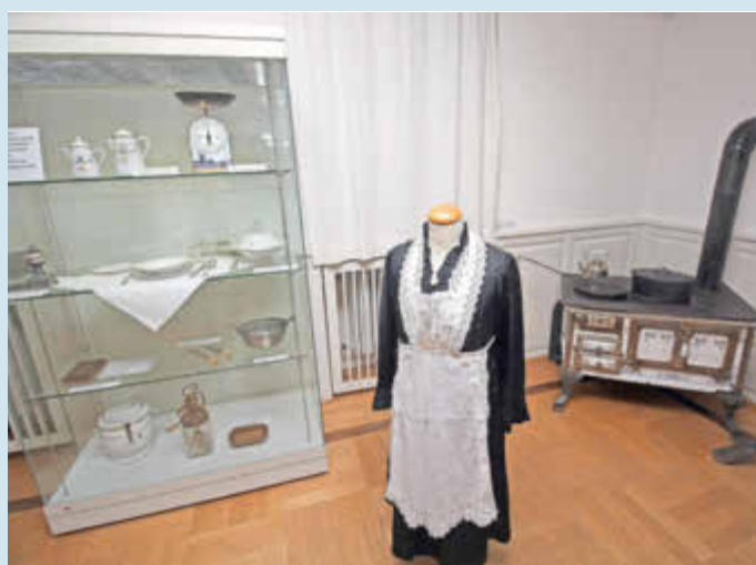
Die mit Spitzen besetzte weiße Schürze war den Dienstmädchen in gut situierten bürgerlichen Haushalten vorbehalten.

Da das INFO-Center diese Woche ins Congress Center Ramstein (CCR) umzieht, ist das Museum künftig nur noch sonntags von 14 bis 17 Uhr geöffnet oder nach Vereinbarung.