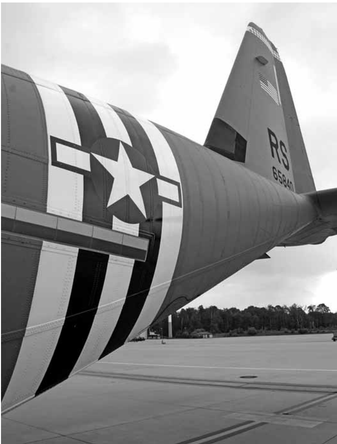
Die Streifen erinnern an die C-47 Maschinen, die im Juni 1944 an der Invasion beteiligt waren (Foto: St. L Hayes).

wird dieser gewaltigen Schlacht an der normannischen Küste gedacht. Museen an den Landungsstränden wie etwa Utah Beach, Omaha Beach oder Juno Beach erinnern an die Schlacht. In diesem Jahr werden zum 75. Jahrestag auch mehrere Staats- und Regierungschefs zu den Feierlichkeiten erwartet. Die Feierlichkeiten haben bereits Ende Mai begonnen und werden bis Mitte Juni andauern.