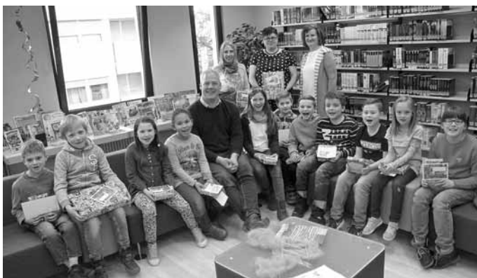
Die Sieger der Aktion „Adventskalender mit Dezembergeschichten“.