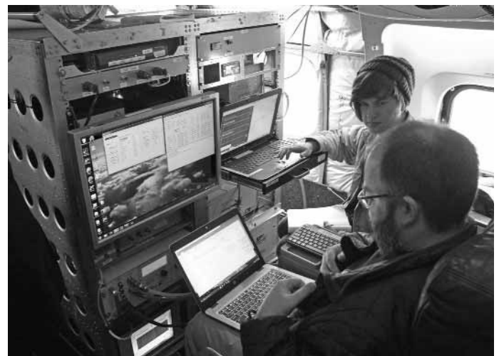
Voller Messgeräte zur Erfassung und Auswertung der Daten ist der Innenraum der DC-8 der NASA.