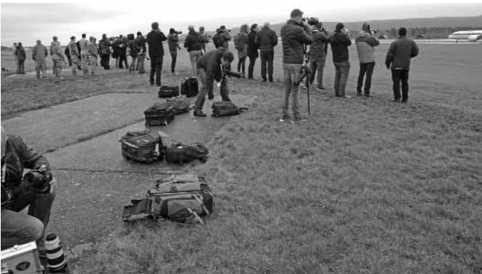
Groß war das Medieninteresse bei der Vorstellung der Forschungsflüge und dem Start der beiden Maschinen.