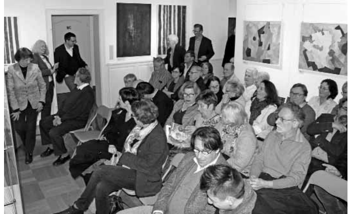
Zur Eröffnung der Ausstellung von Hans Bollen in Ramstein waren alle Plätze im Museum im Westrich besetzt.