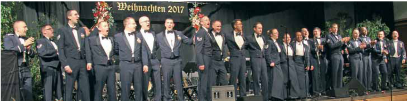
Sie lieben die Musik und die Show und sie beherrschen Beides perfekt: zu „Auld Lang Syne“ kamen die Musiker der USAFE-Band zusammen nach vorne auf die Bühne.