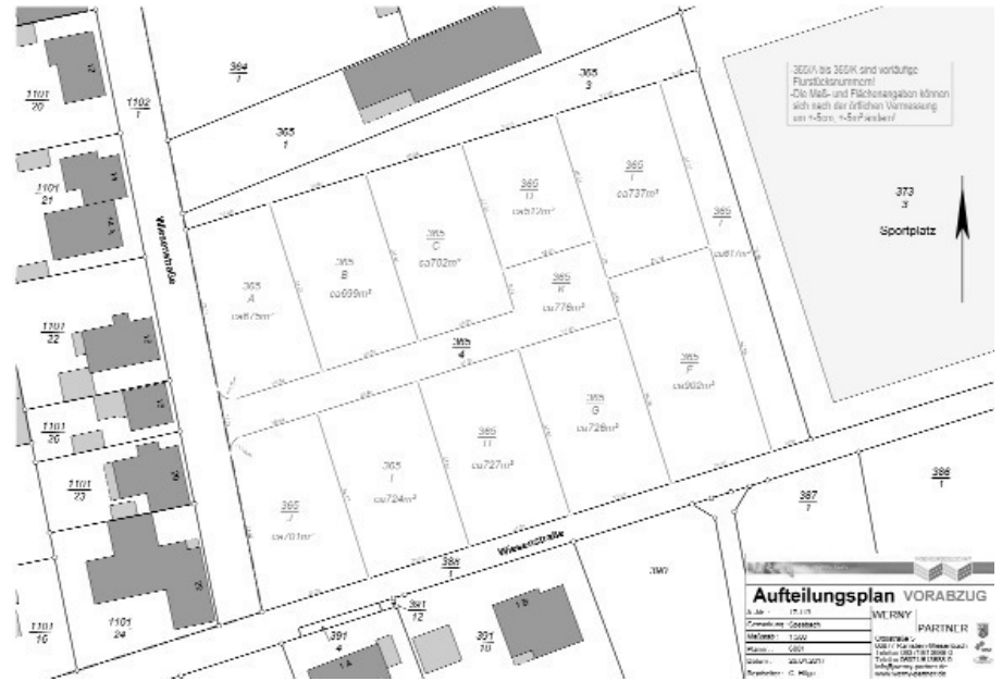
Aus drucktechnischen Gründen musste der Plan verkleinert werden.

Das Bewerbungsformular finden sie auf der Internetseite der Ortsgemeinde Hütschenhausen, „www.huetschenhausen.de“.