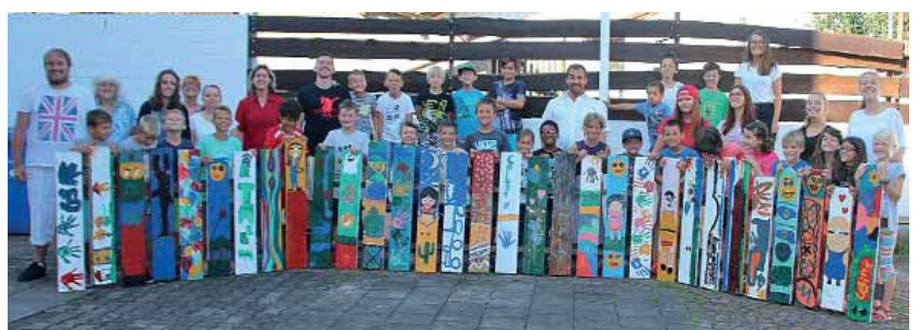
Gruppenbild mit dem fertigen Zaun.