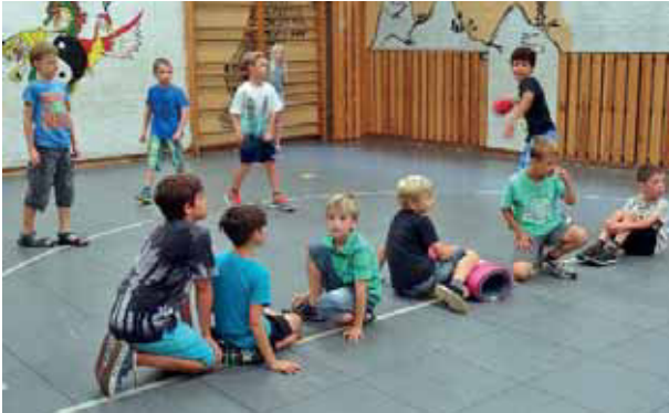
Sport und Spiel in der Turnhalle.