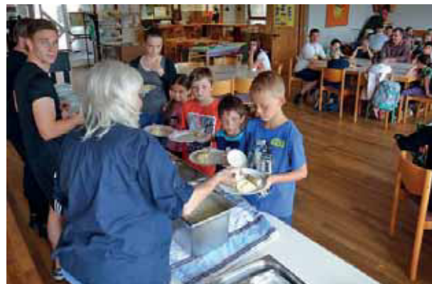
Das Mittagessen wird ausgegeben.