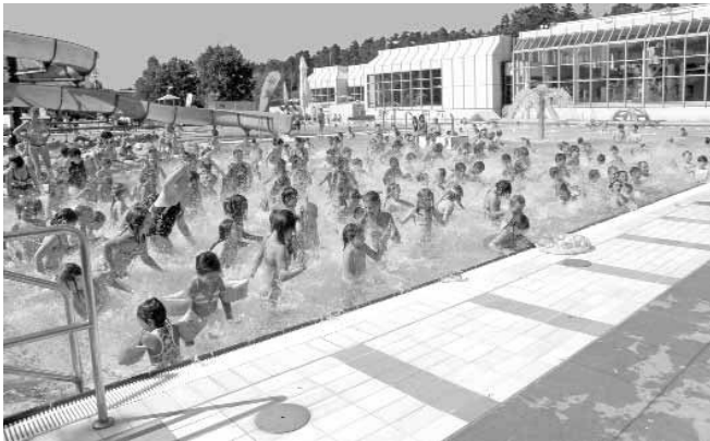
Auch dieses Jahr sorgt das Team vom Freizeitbad-AZUR für Unterhaltung.

Die Schließzeit richtet sich nach der Wetterlage. Es gilt der normale Eintrittspreis des Freizeitbades. Alle Attraktionen sind kostenfrei. Mehr Informationen erhalten Sie unter Telefon 06371 71500 oder unter www.freizeitbad-azur.de .