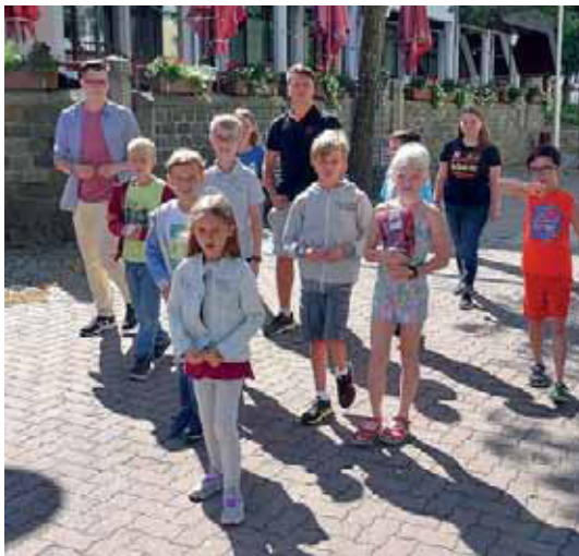
Unterwegs in Ramstein beim Apfel- und Ei-Spiel.