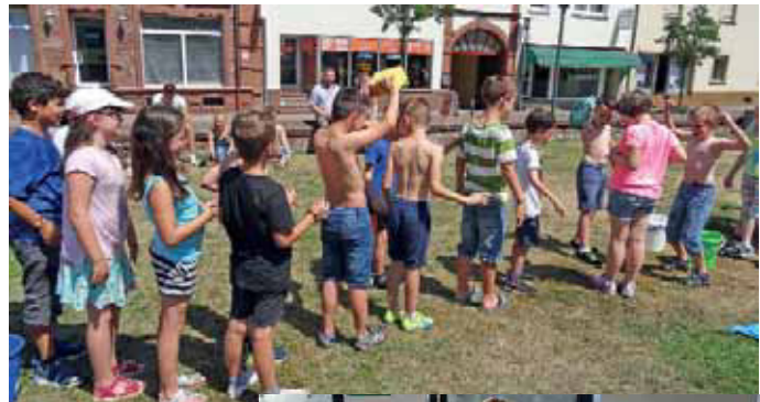
Wasserspiele auf der Wiese.