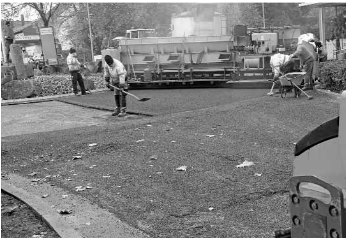
Mit einer Spezialmaschine wurde die Schlussdecke am Löwenkreisel aufgebracht.