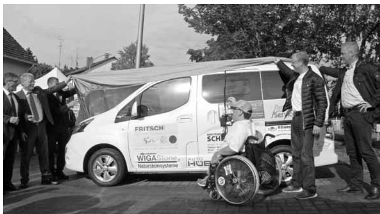
Der elektrisch betriebene und barrierefreie Bürgerbus wird enthüllt.