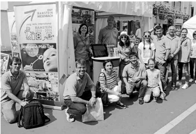
Gut gelaunte Einwohner am Stand ihrer Stadt.