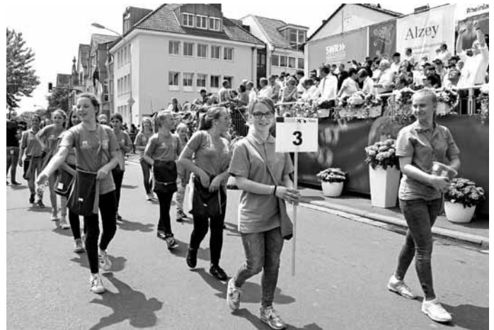
Gardemädels der beiden Karnevalsvereine begleiteten den Wagen.