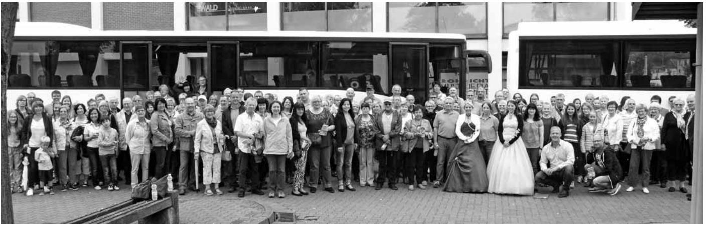
Rund 150 Besucher machten sich von Ramstein-Miesenbach aus auf den Weg nach Alzey.