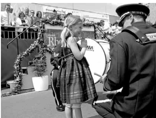
Für Riesenstimmung vor der Ehrentribüne sorgte die USAFE-Band.