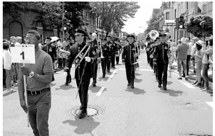
Die USAFE-Band vom Flugplatz Ramstein führte den Festzug zum Rheinland-Pfalz-Tag an.