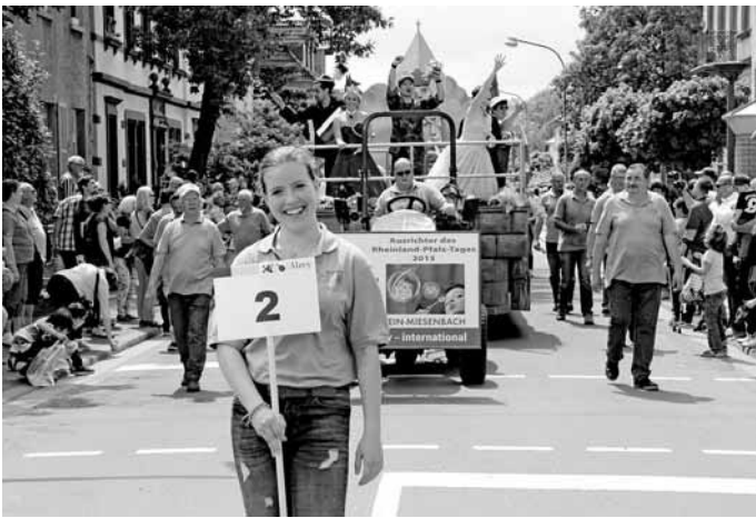
Nummer 2 des Festzuges war der Umzugswagen der Stadt.