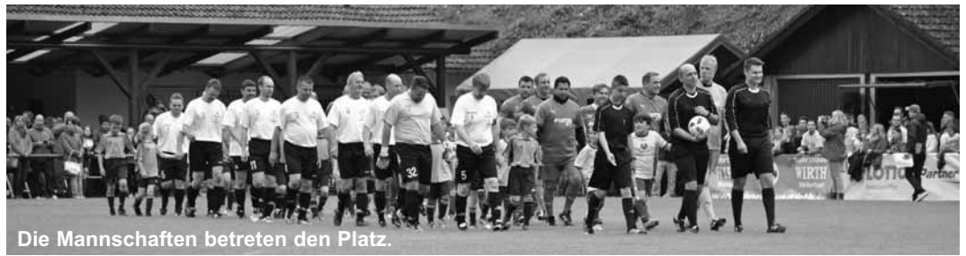
Die Mannschaften betreten den Platz.

Am 24. Mai spielte die Lotto-Elf zum zweiten Mal in Kottweiler-Schwanden auf. Beim Benefizspiel für „Herzessache“, eine Kinderhilfsaktion von SWR, SR und Sparda-bank, konnten sich die ehemaligen Fußballprofis mit prominenter Unterstützung gegen eine U40-Auswahl der Westpfalz mit 9:1 durchsetzen - doch dieses Ergebnis war nebensächlich.