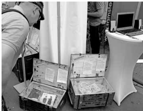
Interessante Objekte aus seiner Sammlung zeigte das Docu Center Ramstein in alten Munitionskisten.