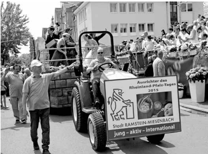
Mit den beiden Karnevalsprinzessinnen der Stadt und historischen Figuren war der Umzugswagen besetzt.