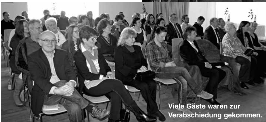
Viele Gäste waren zur Verabschiedung gekommen.

ring und den ehemaligen Kolleginnen aus anderen Kindergärten.