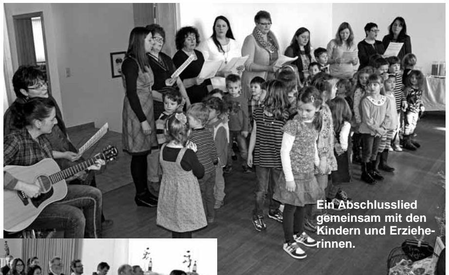
Ein Abschlusslied gemeinsam mit den Kindern und Erzieherinnen.