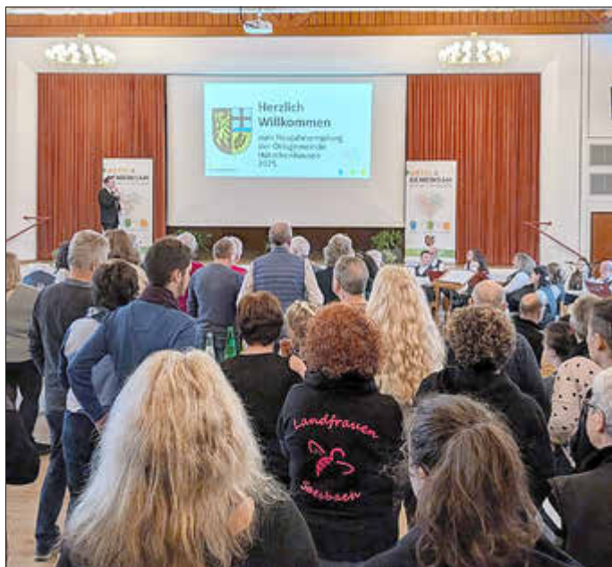
Zahlreiche Bürgerinnen und Bürger folgten der Einladung der Ortsgemeinde Hütschenhausen zum Neujahrsempfang