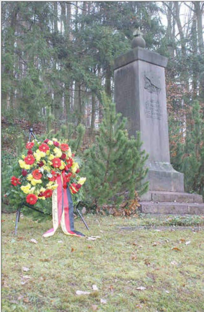
Ehrenmal in Kottweiler-Schwanden