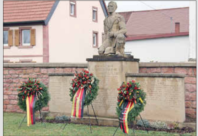
Das Ehrenmal in Katzenbach