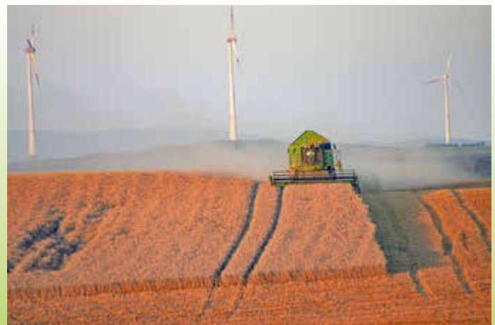
Getreideernte bei Reuschbach