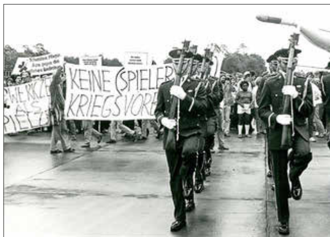
Im August 1983 demonstrierten Friedenaktivisten während des Flugtages auf der Air Base Ramstein.

An ein besonderes Kapitel deutscher Nachkriegsgeschichte erinnert das Docu Center Ramstein (DCR) mit seiner neuen Sonderausstellung „1983: Kalter Krieg und Heißer Herbst“, die am Samstag, den 25. Mai um 14 Uhr auf dem DCR-Ausstellungsgelände eröffnet wird (Schernauer Str. 46 in Ramstein).